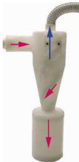
Fig. 6 / Abb. 6