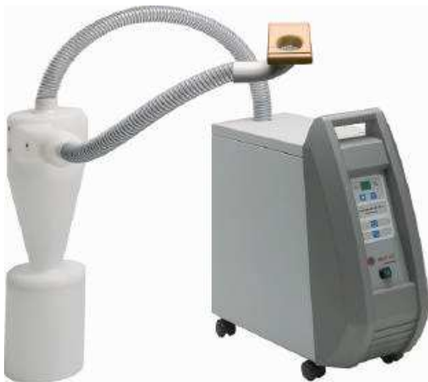
Fig. 3 / Abb. 3