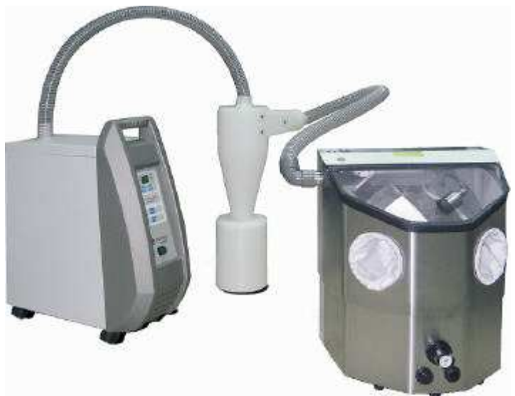
Fig. 4 / Abb. 4