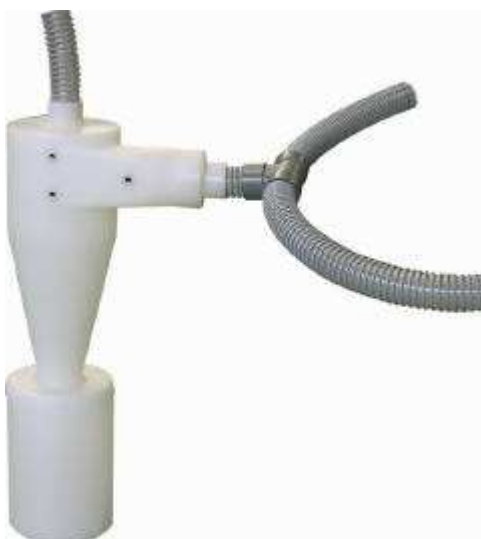
Fig. 5 / Abb. 5