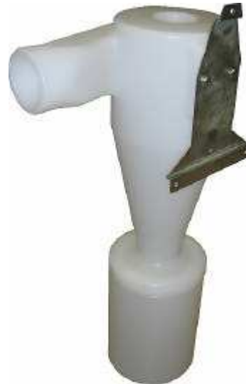
Fig. 2 / Abb. 2