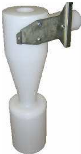
Fig. 1 / Abb. 1